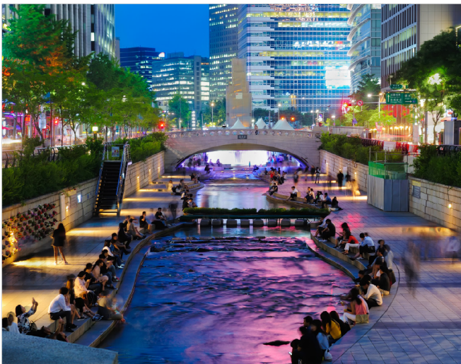
Le parc du cours d'eau de Cheonggyecheon à Séoul, en Corée

Sociétés de l'équipe de rêve – Ces sociétés possèdent les caractéristiques commerciales, financières et de gestion que Burgundy juge de grande qualité, mais leur cours actuel n'offre pas une marge de sécurité suffisante pour justifier un placement.