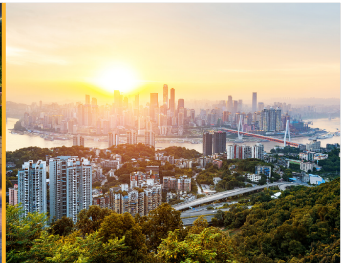
La rivière Yangtze traversant Chongqing, en Chine